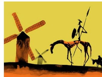
Don Quijot de la Mancha na jednom z řady vyobrazení.

► Které portugalské državy v zámoří Filipa II. získal?